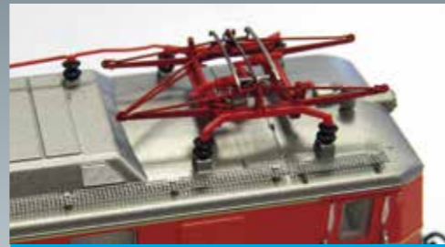
Filigrane und hochwertige Stromabnehmer