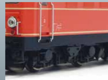
Scharf gravierte Drehgestelle