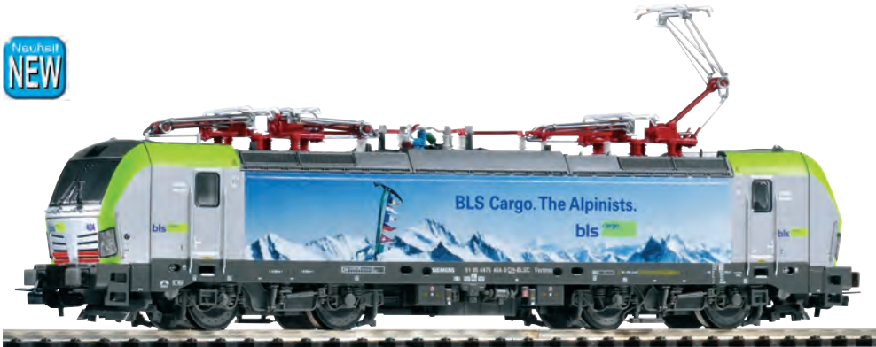
97761 E-Lok Vectron BR 475 404 BLS Cargo Ep. VI, mit 4 Stromabnehmern 97762 E-Lok Vectron BR 475 404 BLS Cargo Ep. VI, mit 4 Stromabnehmern 97761 Locomotive électrique BR 475 404 BLS Cargo ép. VI 97762 Locomotive électrique BR 475 404 BLS Cargo ép. VI