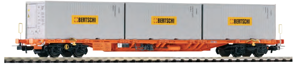
54680 Tragwagen Sgnss „Wascosa“ SBB Ep. VI, mit 3x20' Containern „BERTSCHI“ 54680 Wagon plat type Sgnss „Wascosa“ CFF ép. VI, avec 3 containers 20' „BERTSCHI“