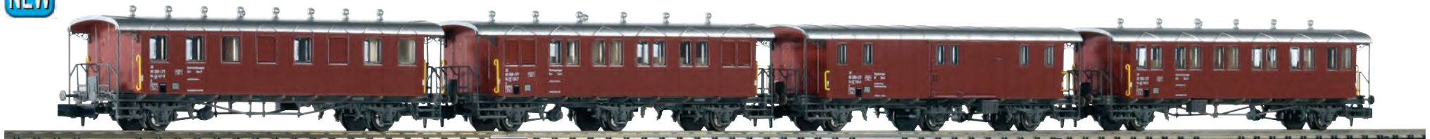
94346 SBB-CFF Bauzugset Epoche IV: Magazinwagen, Werkzeugwagen und 2 Unterkunftswagen (ex F3, B3, B2 und C2)