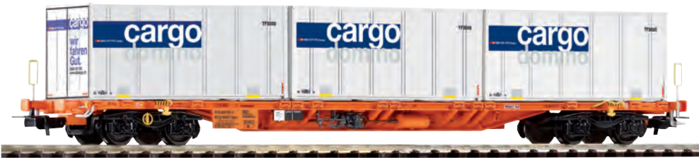
95330 Tragwagen Sgnss „Wascosa“ SBB Ep. VI, mit 3x20' Containern „Cargo Domino“ 95330 Wagon plat type Sgnss „Wascosa“ CFF ép. VI, avec 3 containers 20' „Cargo Domino“