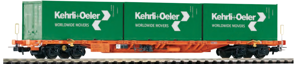
54685 Tragwagen Sgnss SBB Ep. VI, mit 3x20' Containern „Kehri und Oeler“ 54685 Wagon plat type Sgnss CFF ép. VI, 3 containers 20' „Kehri und Oeler“