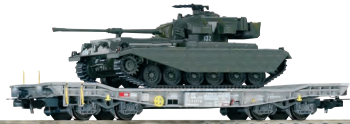
96681 Panzertransportwagen Slmmnps SBB Ep. IV - V, beladen mit Panzer 57 Nr. 132 mit Seitenschürzen 96681 Wagon CFF porte char type Slmmnps chargé d'un char PZ 57 no. 132 avec protection latérale