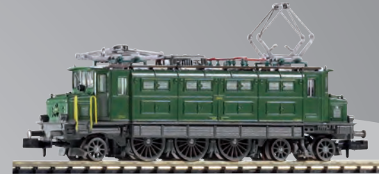
Die Seiten der Lok sind wie im Original unterschiedlich. Les deux côtés de la locomotive sont différents.