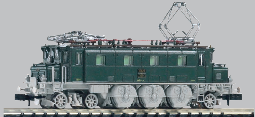
40323 Elektrolokomotive Ae 3/6I 10619 SBB Ep. III 40323 Locomotive électrique Ae 3/6I 10619 CFF ép. III

Technische und farbliche Änderungen bei den Artikeln sowie Irrtümer und Liefermöglichkeiten vorbehalten; Maße und Abbildungen freibleibend.