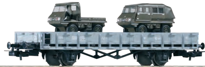
95340 Flachwagen SBB Ep. III, beladen mit Steyr-Puch Haflinger Geländewagen 95340 Wagon plat CFF ép. III avec 2 véhicules tout terrain Steyr-Puch Haflinger