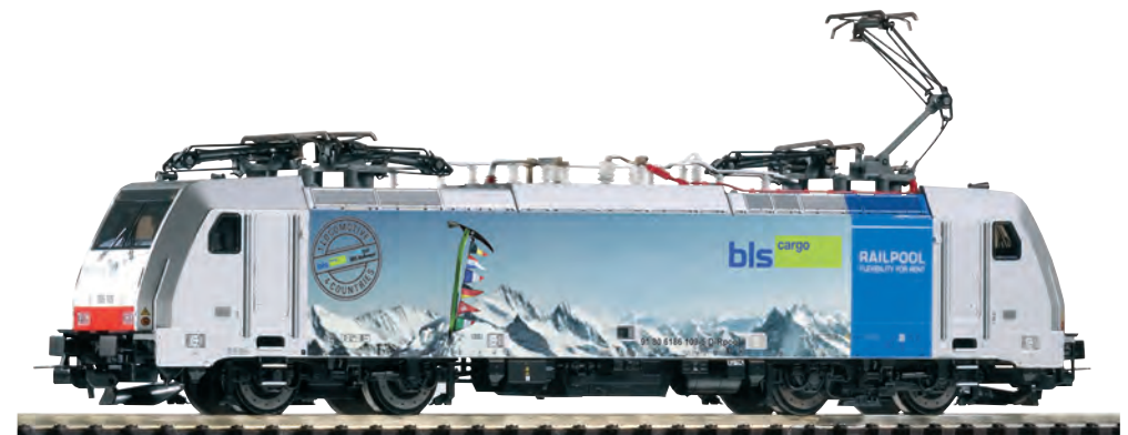
59961 Elektrolokomotive BR 186 BLS Cargo Ep. VI 59861 Elektrolokomotive BR 186 BLS Cargo Ep. VI 59961 Locomotive électrique BR 186 BLS Cargo ép. VI 59861 Locomotive électrique BR 186 BLS Cargo ép. VI