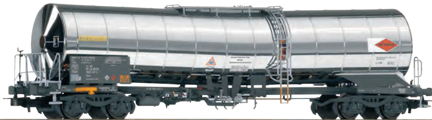
54766 Chemiekesselwagen „MITRAG“ SBB Ep. VI 54766 Wagon chimique „MITRAG“ CFF ép. VI