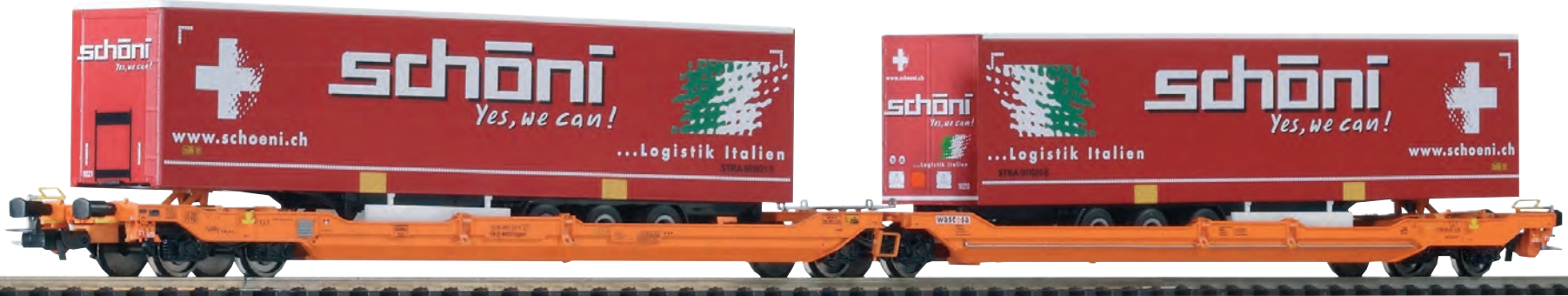
54773 Taschenwagen T3000e „Wascosa“ Ep. VI, mit zwei Aufliegern 54773 Wagon poche type T3000e „Wascosa“ avec deux semi-remorques