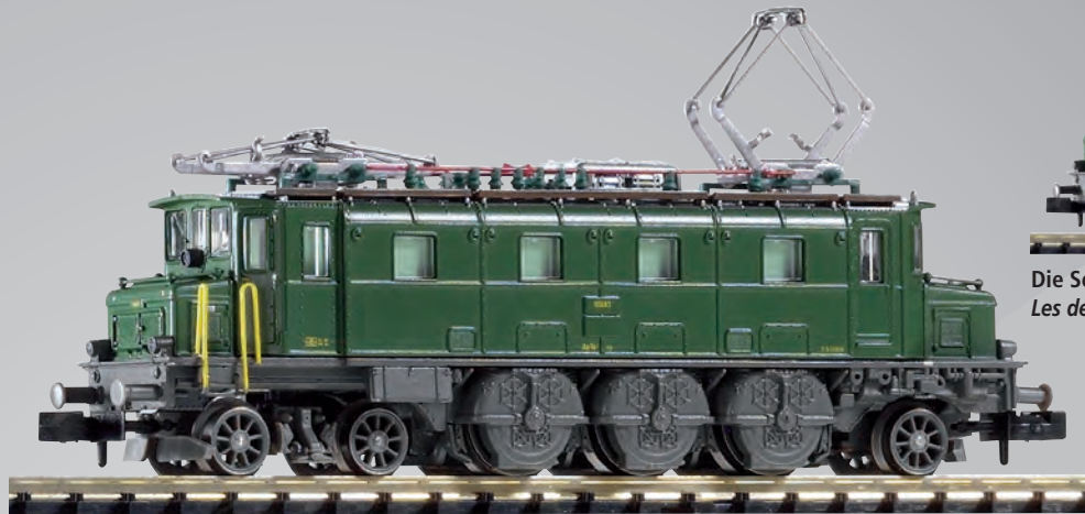
40322 Elektrolokomotive Ae 3/6I 10639 SBB Ep. IV mit geänderter Dachform 40322 Locomotive électrique Ae 3/6I 10639 CFF ép. IV avec toiture modifiée