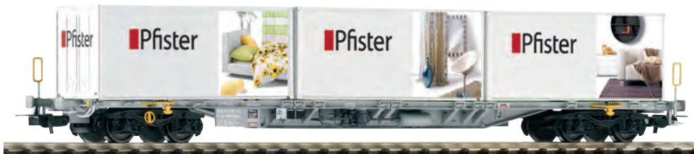
54682 Tragwagen Sgnss SBB Ep. VI, mit 3x20' Containern „Pfister“ 54682 Wagon plat type Sgnss CFF ép. VI, 3 containers 20' „Pfister“