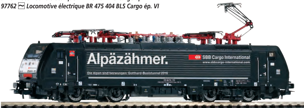
57965 Elektrolok BR 189 MRCE Alpazähler Ep. VI 57865 Elektrolok BR 189 MRCE Alpazähler Ep. VI 57965 Locomotive électrique BR 189 MRCE Alpazähler ép. VI 57865 Locomotive électrique BR 189 MRCE Alpazähler ép. VI