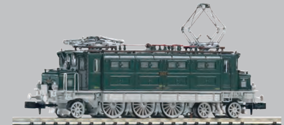
Die Seiten der Lok sind wie im Original unterschiedlich. Les deux côtés de la locomotive sont différents.