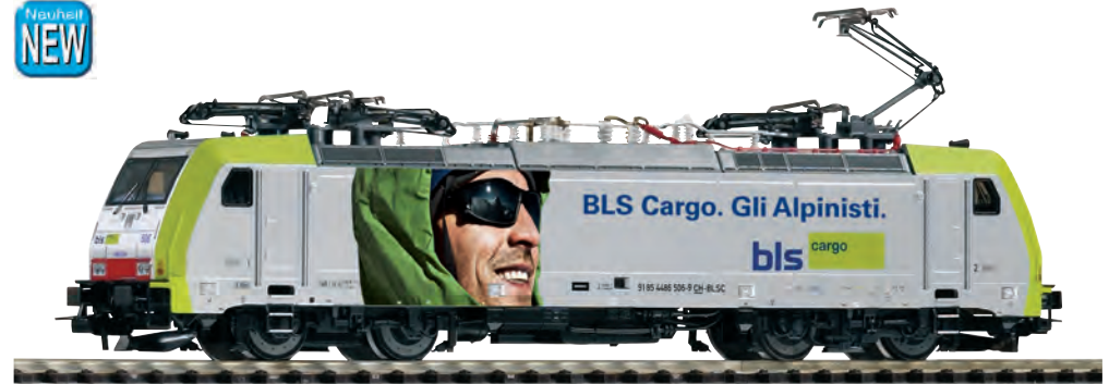
59964 Elektrolok BR 486 „Alpinisti“ BLS Ep. VI 59864 Elektrolok BR 486 „Alpinisti“ BLS Ep. VI 59964 Locomotive électrique BR 486 „Alpinisti“ BLS ép. VI 59864 Locomotive électrique BR 486 „Alpinisti“ BLS ép. VI