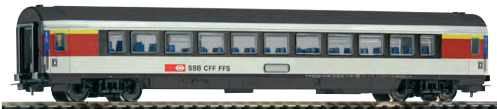
57628 Eurocitywagen 1.Kl. Apm SBB Ep. V 57629 Eurocitywagen 2.Kl. Bpm SBB Ep. V