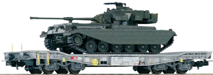
96680 Panzertransportwagen Slmmnps SBB Ep. IV - V, beladen mit Panzer 57 Nr. 131 mit Seitenschürzen 96680 Wagon CFF porte char type Slmmnps chargé d'un char PZ 57 no. 131 avec protection latérale