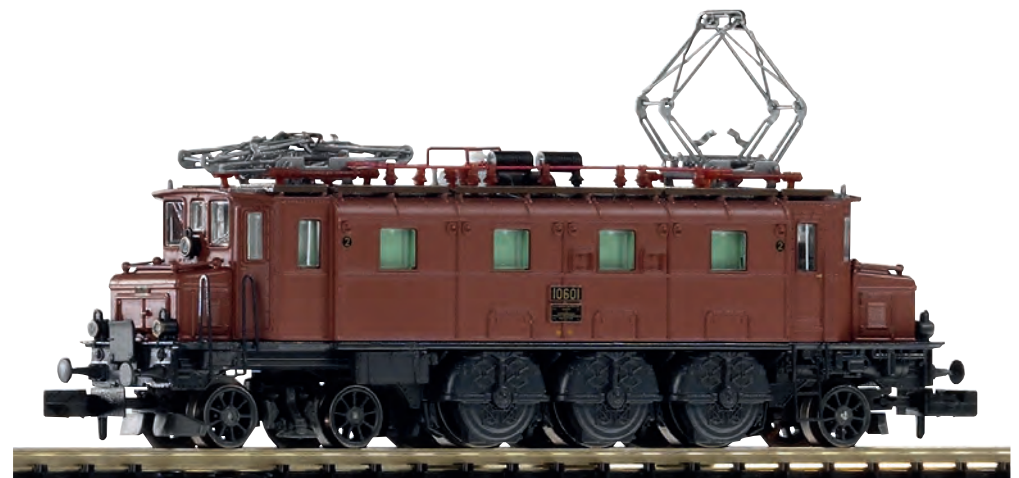
40320 Elektrolokomotive Ae 3/61 10601 SBB Ep. II 40320 Locomotive électrique Ae 3/61 10601 CFF ép. II