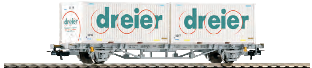
57785 Containertragwagen „DREIER“ SBB Ep. VI 57785 Wagon plat CFF ép. VI, 2 containers 20' „DREIER“