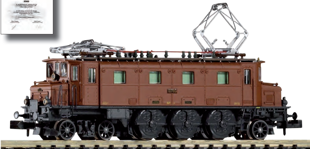
94003 Elektrolokomotive Ae 3/61 10700 SBB-HISTORIC Ep. IV-VI 94003 Locomotive électrique Ae 3/61 10700 CFF-HISTORIC ép. IV-VI