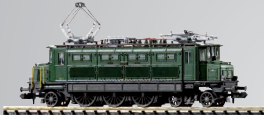
Die Seiten der Lok sind wie im Original unterschiedlich. Les deux côtés de la locomotive sont différents.